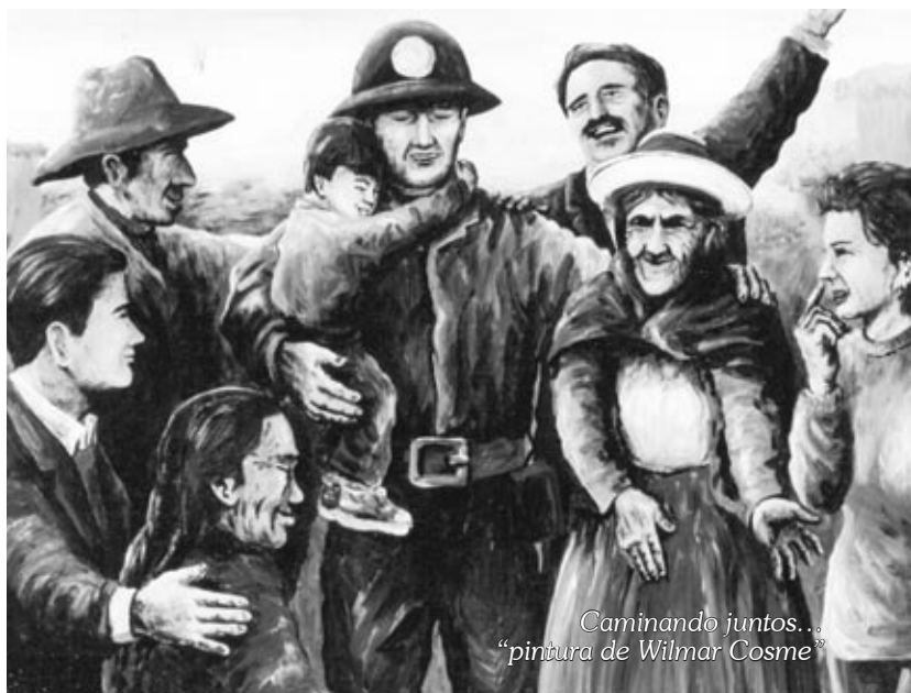
Caminando juntos... "pintura de Wilmar Cosme"

Es necesario que en este proceso las autoridades, funcionarios de las empresas mineras, líderes sociales y quienes ingresen a los espacios de decisión público y privado a nivel nacional, regional y locales, puedan acompañarnos y compartir sus inquietudes y aspiraciones para que el Diálogo sirva como forma de superar diferencias y establecer acciones proactivas conjuntas.