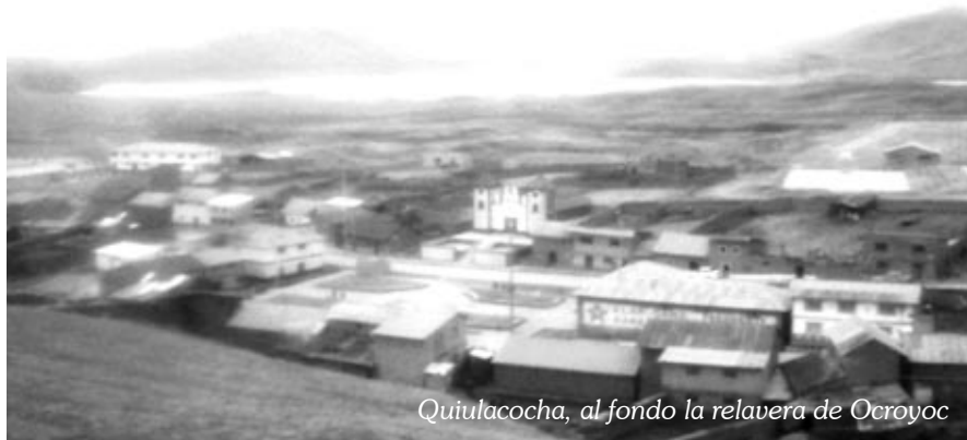
Quiulacocha, al fondo la relavera de Ocroycoc