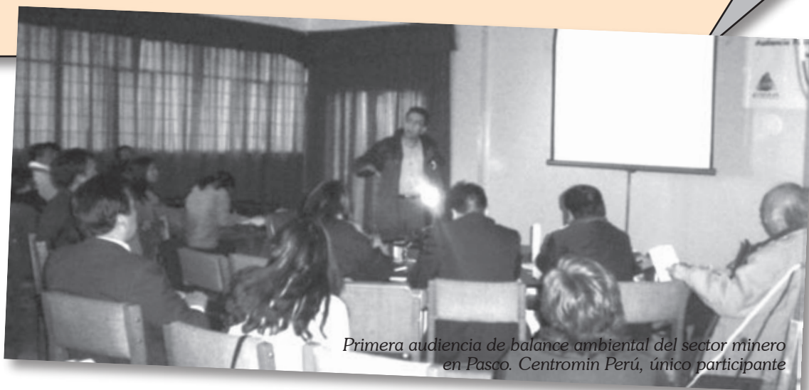
Primera audiencia de balance ambiental del sector minero en Pasco. Centromin Perú, único participante