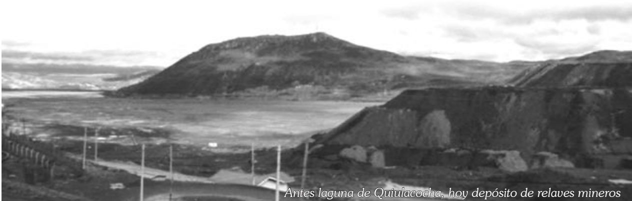
Antes laguna de Quiulacocha, hoy depósito de relaves mineros

Para este proceso, se ha destinado la suma de 20 millones de dólares en calidad de fideicomiso, que lo debe ejecutar el Ministerio de Energía y Minas, para ello se ha nombrado un directorio, para invertir en la recuperación de las áreas afectadas por los pasivos ambientales. Dicho directorio está conformado por representantes de Centromin Perú, Ministerio de Energía y Minas, CONAFE, Ministerio de Economía y Finanzas (un representante por cada uno), los mismos que ejecutarán proyectos para la recuperación de las áreas afectadas.