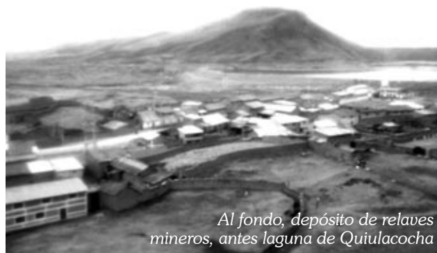
Al fondo, depósito de relaves mineros, antes laguna de Quiulacocha

Por otro lado, es necesario mencionar que Quiulacocha cuenta con una serie de tradiciones los