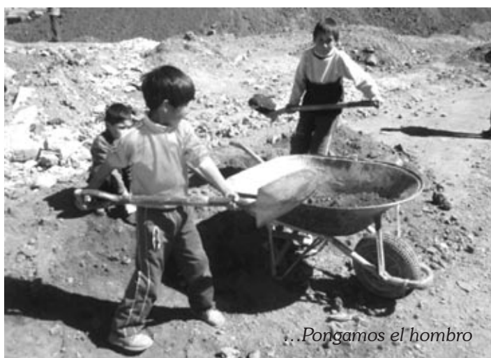
...Pongamos el hombro