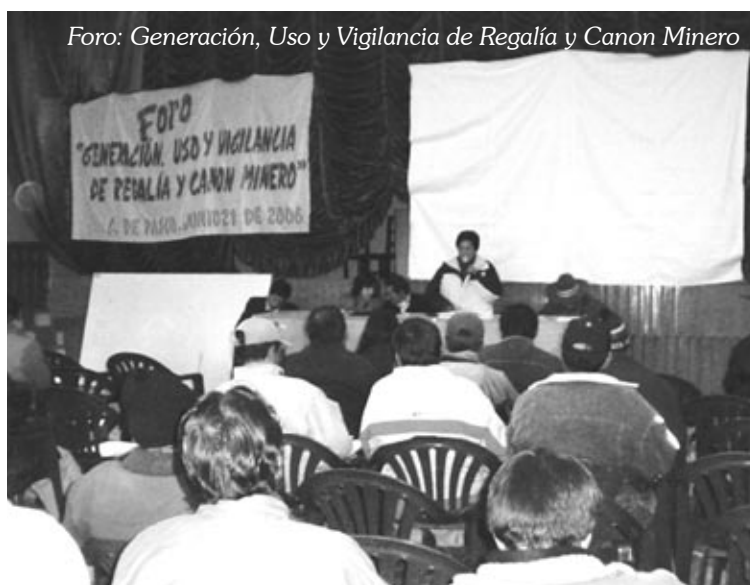
Foro: Generación, Uso y Vigilancia de Regalía y Canon Minero

nómico de cada región, así asegurar el desarrollo sostenible de las áreas urbana y rurales. En el caso de los fondos que reciben las universidades, esta debe ser exclusivamente invertida en investigación científica y tecnológica.