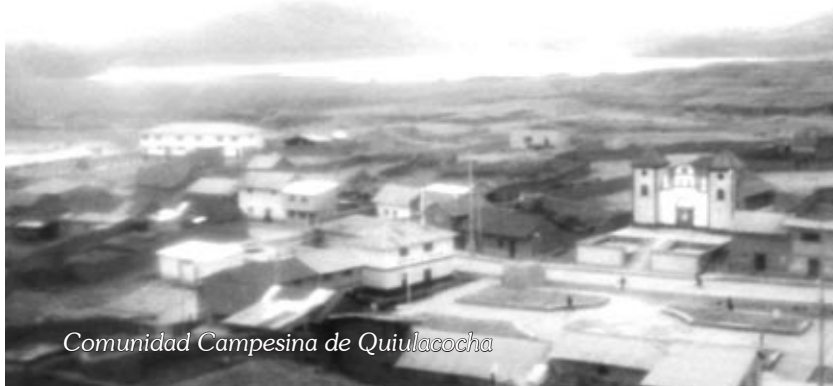
Comunidad Campesina de Quiulacocha

peces están las chalgas, bagre, trucha y en batracios están los sapos, huancha, rana, etc. Su flora no es tan abundante, teniendo como principales a la Shupta, antañawi, berros, descorzoner negra, huachaugaua, garbanzo, huamantimpa, raíz altia, pomayzanca, jankahuasha, chircagua, ticlluy, ichu, cushuro, entre otros. En recursos minerales , en poca cantidad se encuentra el carbón y las piedras calizas.