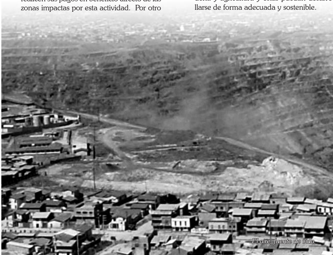
El aire, fuente de vida.