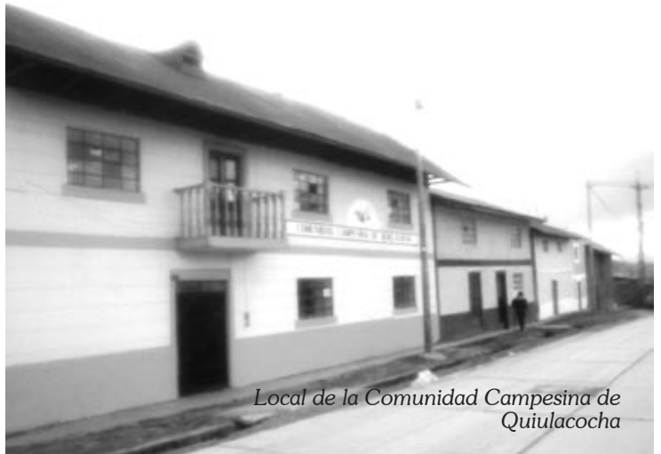
Local de la Comunidad Campesina de Quiulacocha

Al parecer desde Centromin Perú, no se ha tenido un estudio adecuado, porque no se tiene resultados favorables para la comunidad. Como comunidad nosotros no contamos con recursos para el mantenimiento de estas plantaciones. De mil cien plantas que se sembraron, solo estimamos que hasta ahora existen 300 plantas y en pésimas condiciones; Centromin Perú los sembró y los dejó.