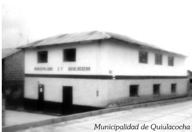
Municipalidad de Quiulacocha

También, lo que esta afectando a nuestra comunidad es el transporte de minerales que pasa por nuestra comunidad, trasladando concentrados