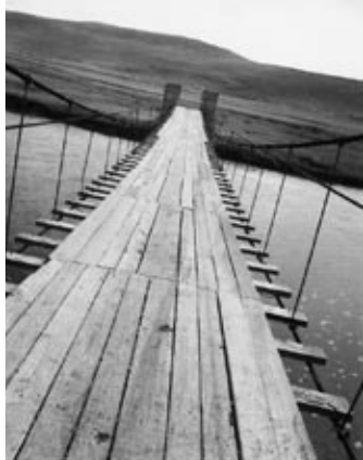
Puente colgante "Puga" (sobre el río Mantaro), Anexo de Chacpay"

por la Empresa Cerro de Pasco Cooper Corporación para generar energía eléctrica y con ella mover sus cuantiosas máquinas de explotación; las piedras usadas en la represa lo extrajeron del Complejo Arqueológico de "Tambo Inca", hoy llamado "Pumpo Marca" o "Llacta de Pumpo" que albergaba a más de 60,000 habitantes en la época incaica; lo