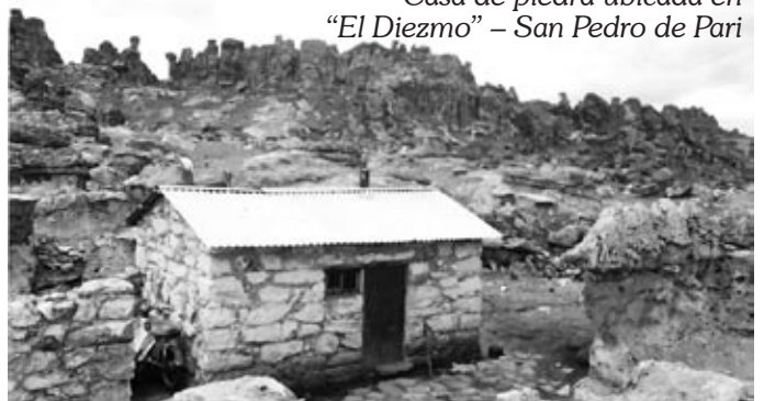
Casa de piedra ubicada en "El Diezmo" - San Pedro de Pari

Sobre ello, el 6 de febrero de 2002 mediante Recurso N° 1351697 se presentó la denuncia contra la Empresa Administradora Chungar S.A.C. y la Compañía Minera Huaron S.A. ante la Dirección General de Minería del Ministerio de Energía y Minas, por la contaminación de las aguas de los Ríos San José, Anticonca y por los daños a los campos pastizales desde la zona de Canchacucho al Río Mantaro.