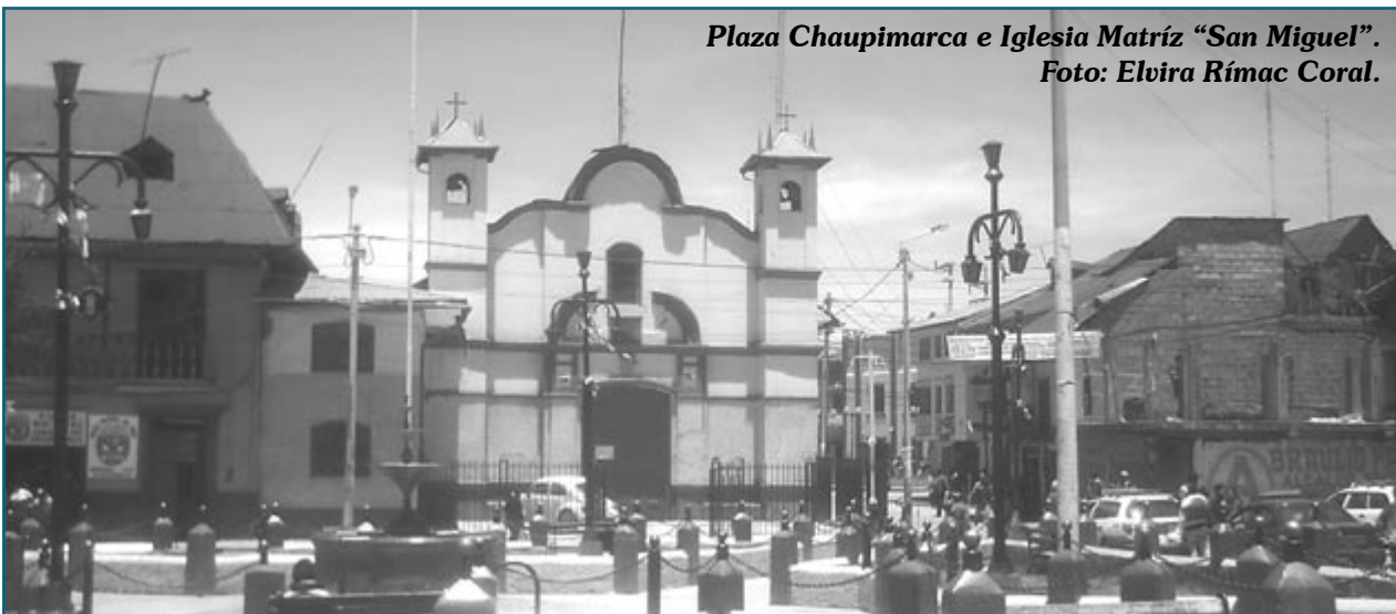
Plaza Chaupimarca e Iglesia Matriz "San Miguel".

No se esta enfocando en este plan de cómo está tratando el problema de plomo en la sangre, cómo se esta tratando de resarcir el problema de las viviendas rajadas... todos estos puntos es necesario llamar a reflexión a la empresa..."